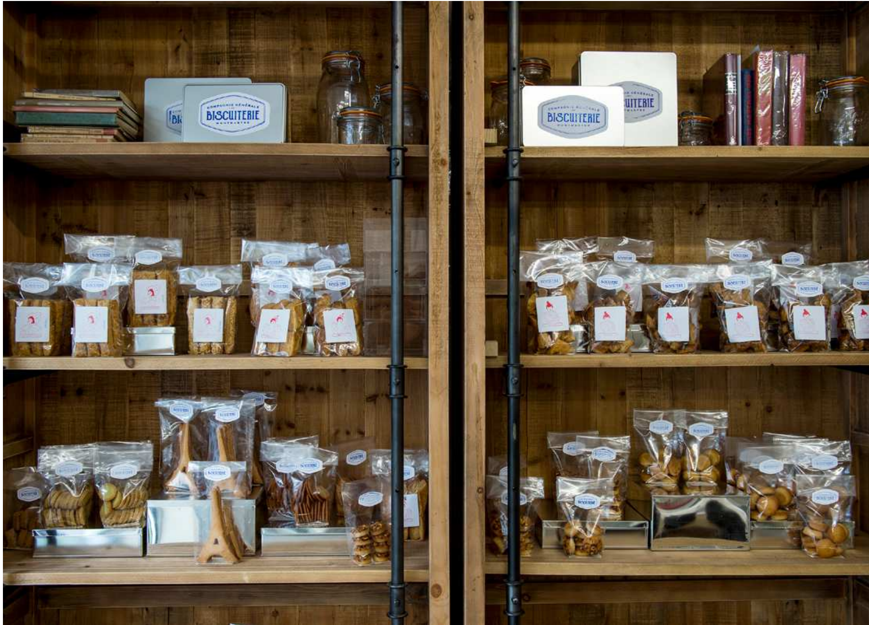
COMPAGNIE GENERALE DE BISCUITERIE : Visual identity and package design