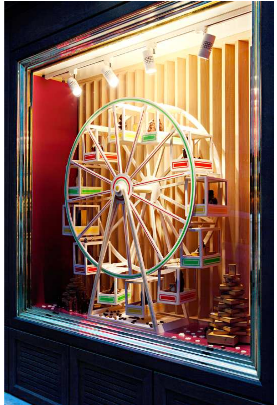
MICHEL CHAUDUN : Windows of the Chaudun House, Paris 7, 149 rue de l'Université