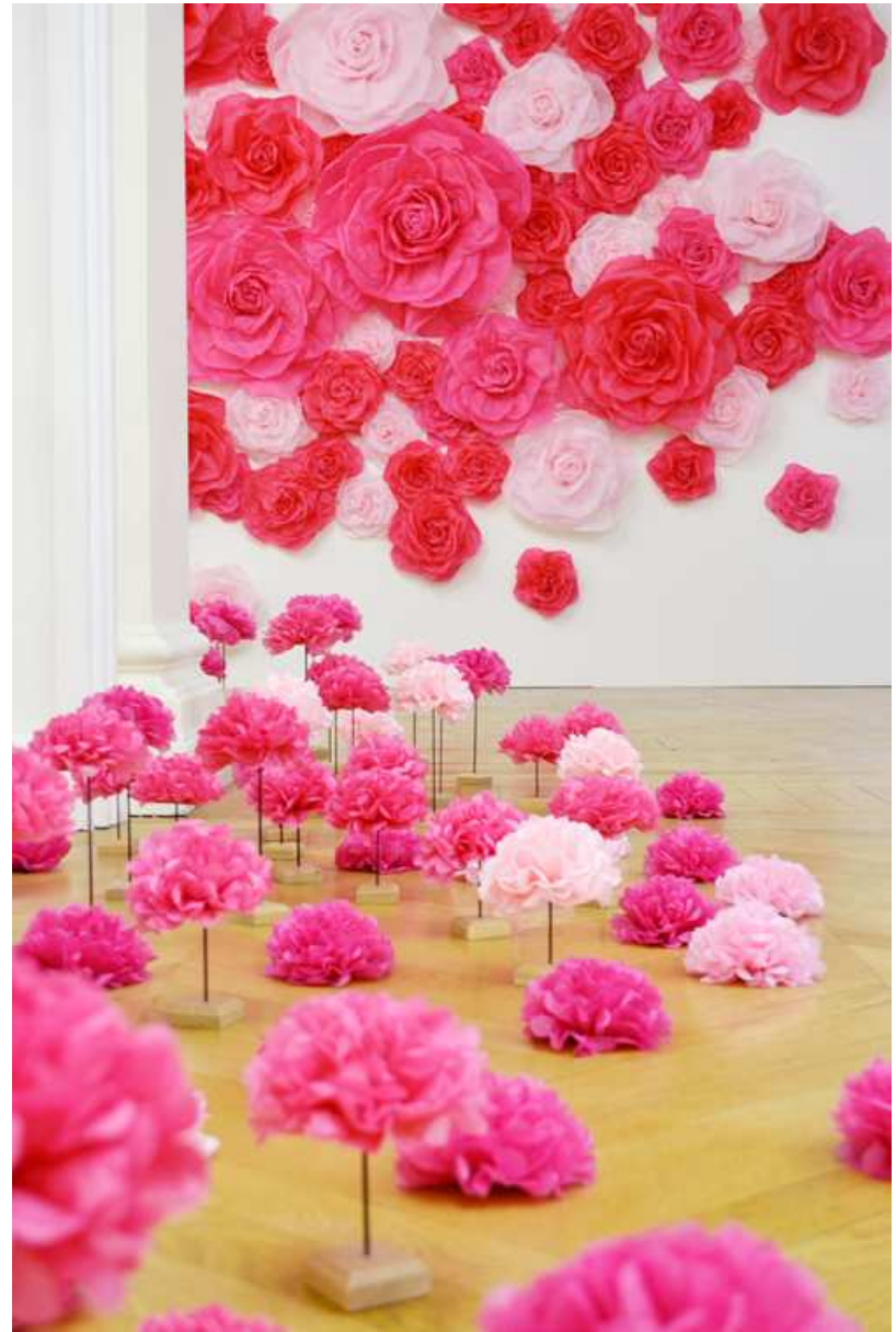
ANNICK GOUTAL : Press event for the launch of the new perfum « Rose Pompon »