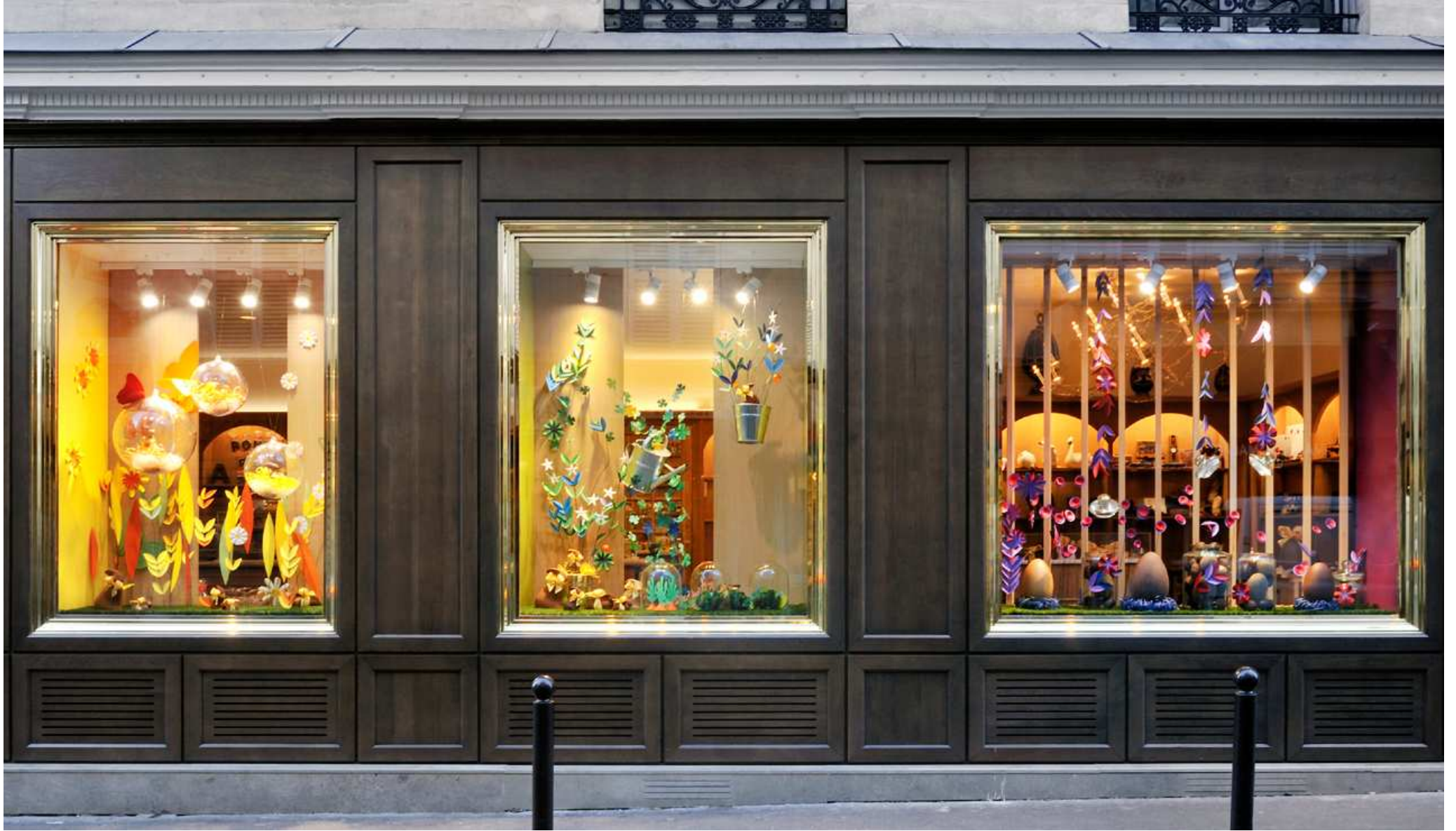
MICHEL CHAUDUN : Easter windows, Chaudun House, Paris 7