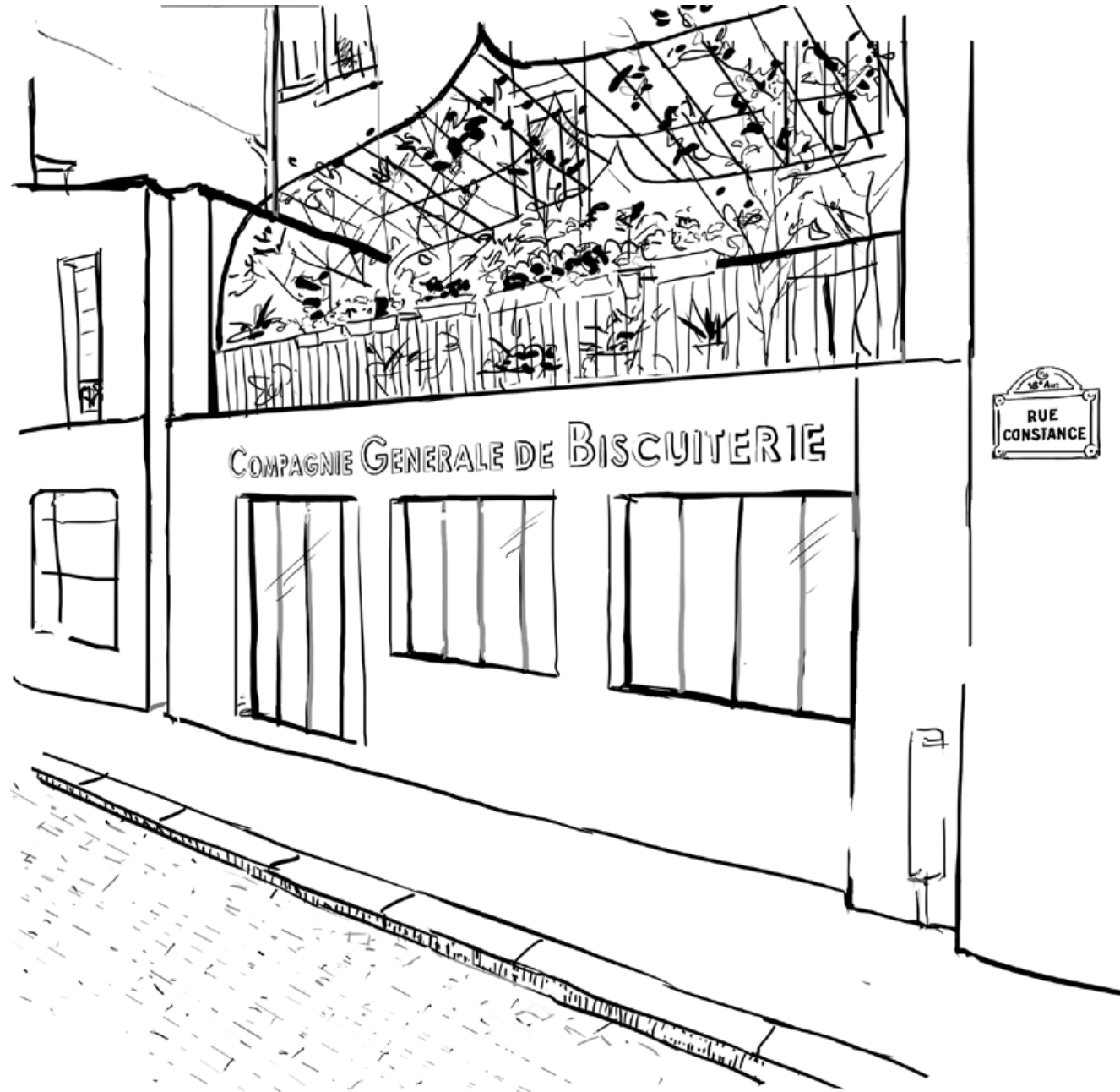
COMPAGNIE GENERALE DE BISCUITERIE : Sketch of the atelier, Montmartre