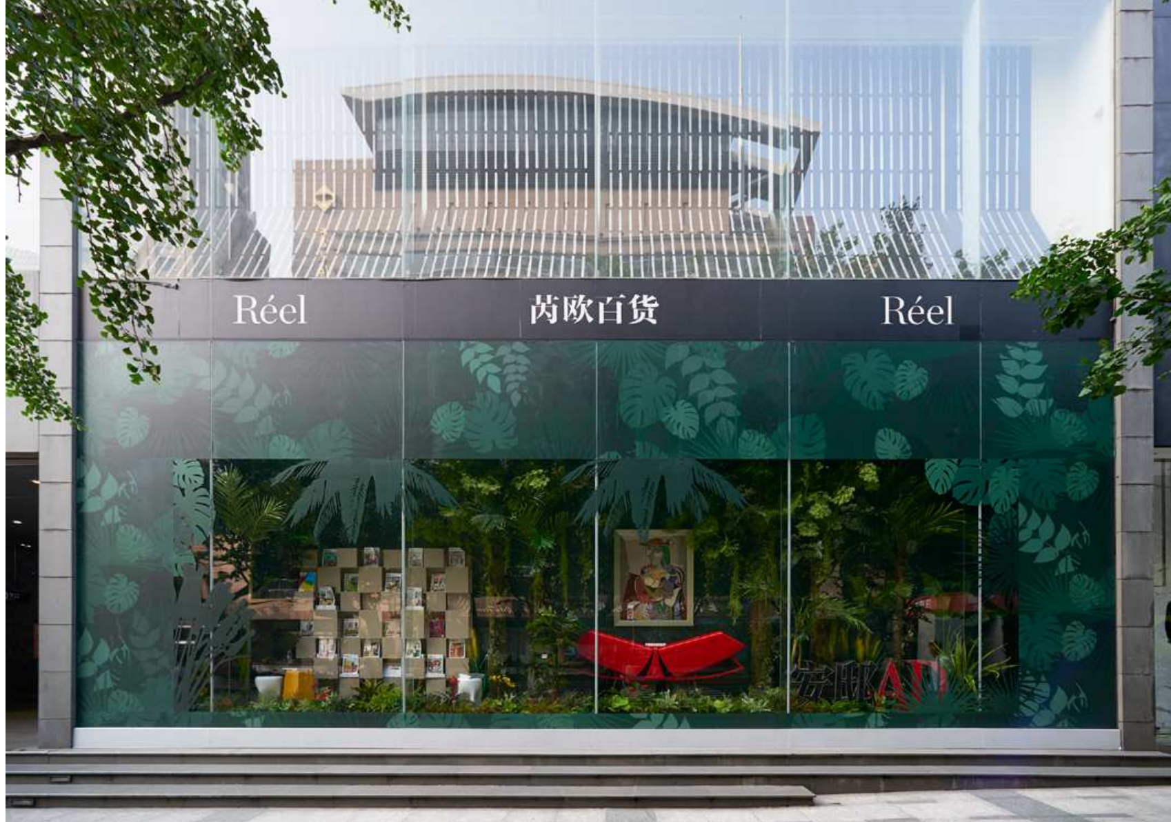
MAGAZINE AD / REEL MALL SHANGHAI : Window design