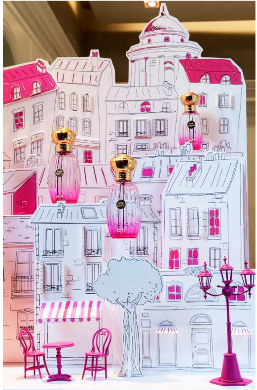
ANNICK GOUTAL : A stroll in Paris windows, rue de Courcelles