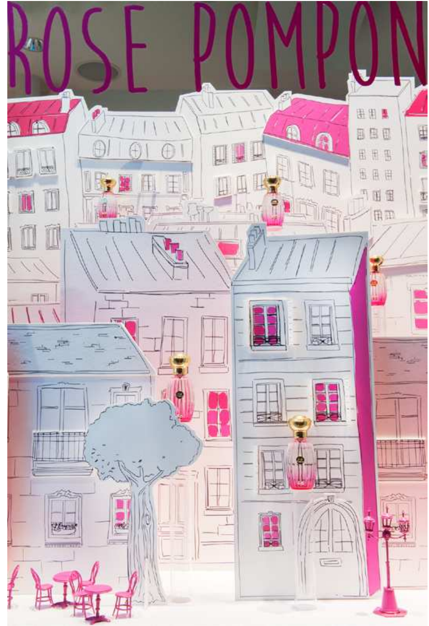
ANNICK GOUTAL : A stroll in Paris windows, rue Saint Sulpice