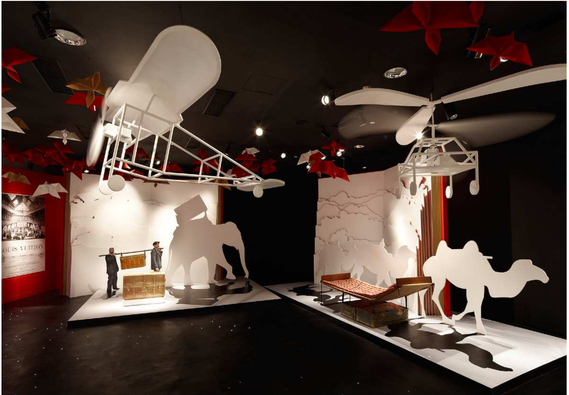
LOUIS VUITTON : Paris 1867-Shanghai 2010 - Scenography of the Louis Vuitton retrospective in Shanghai - 2010