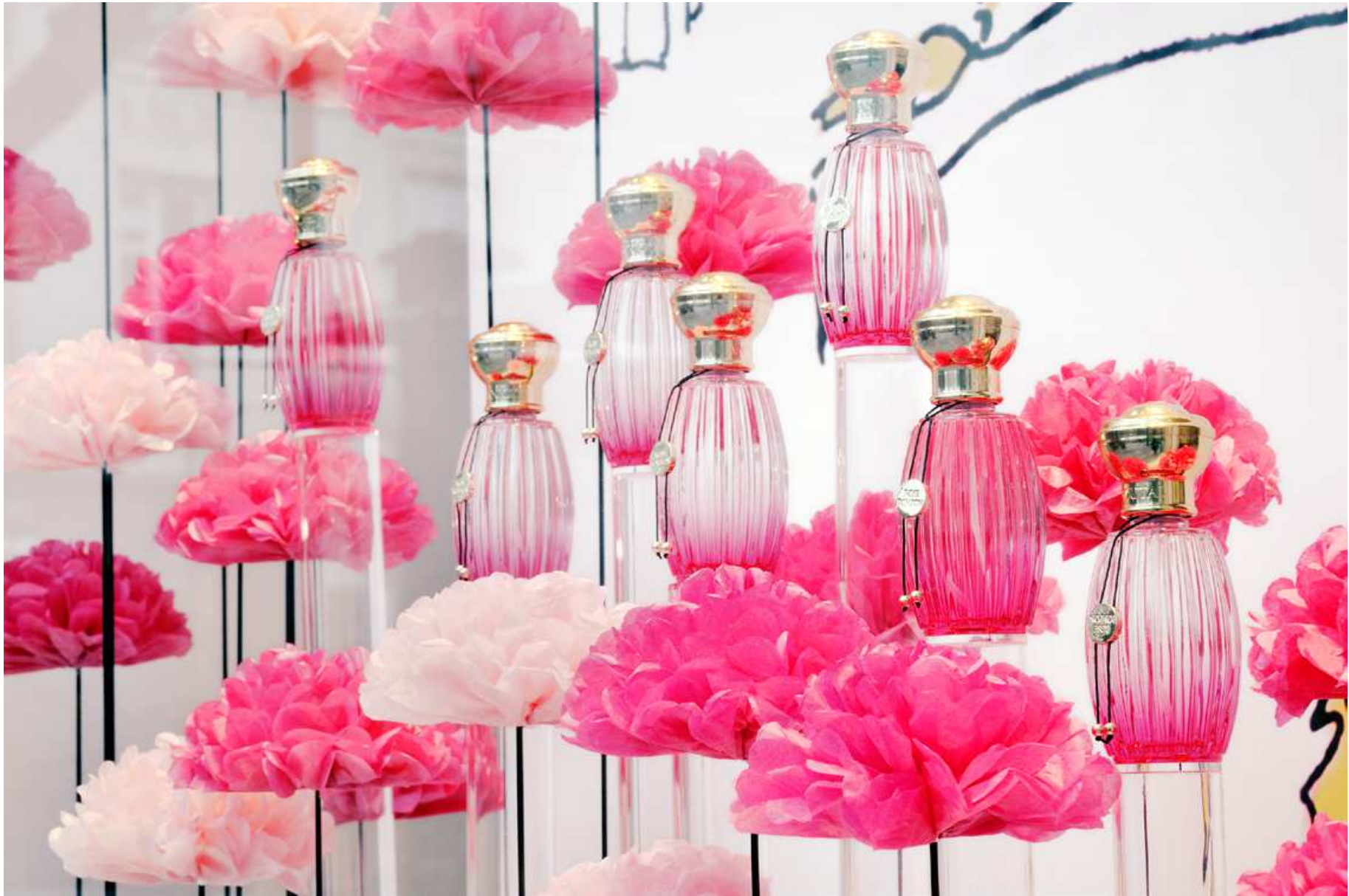
ANNICK GOUTAL : Press event for the launch of the new perfum « Rose Pompon »