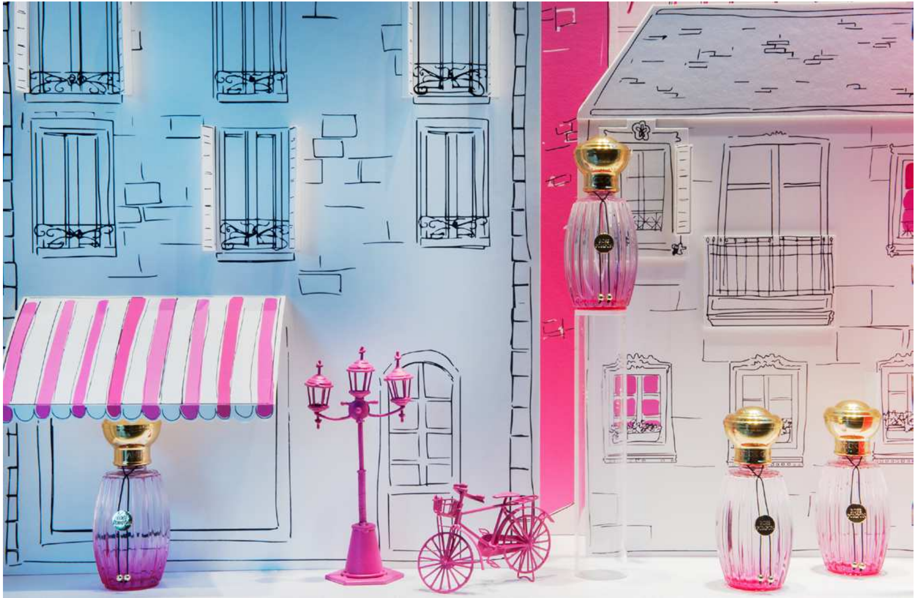
ANNICK GOUTAL : A stroll in Paris windows, rue Saint Sulpice