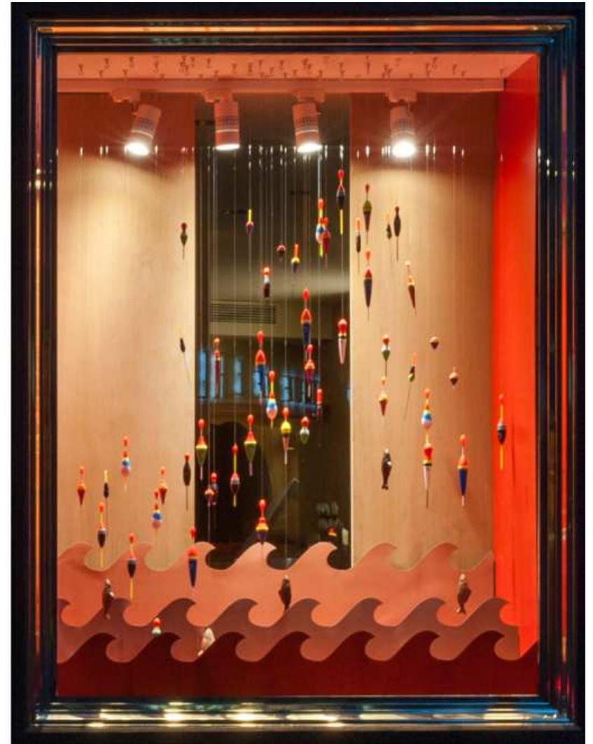
MICHEL CHAUDUN : Summer windows of the Chaudun House, Paris 7