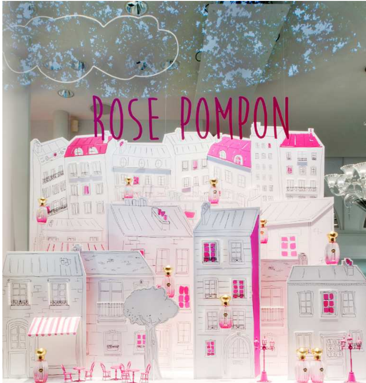
ANNICK GOUTAL : A stroll in Paris windows, rue Saint Sulpice