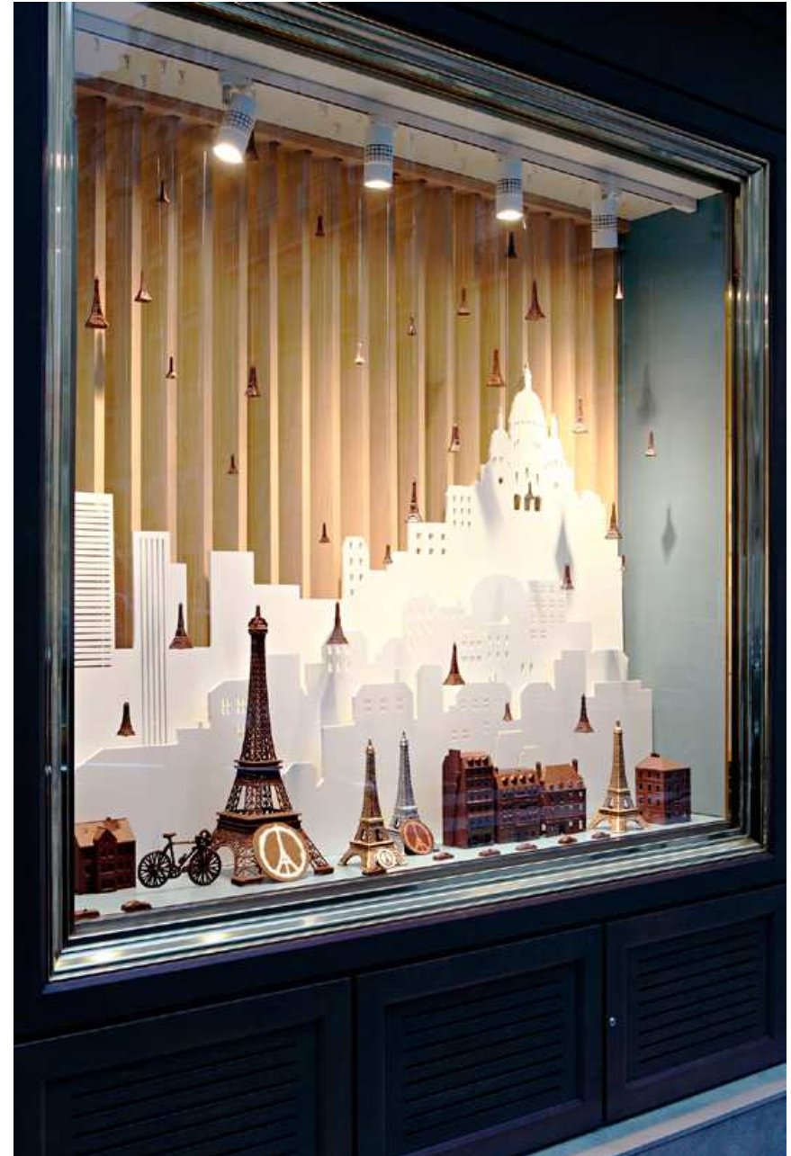
MICHEL CHAUDUN : Windows of the Chaudun House, Paris 7, 149 rue de l'Université